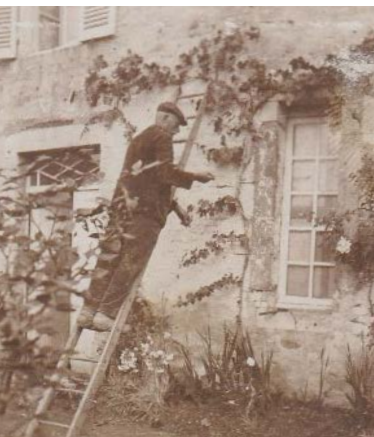
Taille de la vigne