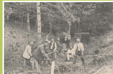
Dossier : économie locale en 1836