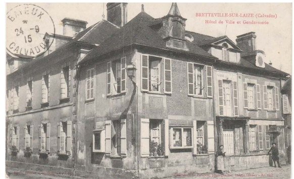
Hôtel de ville et gendarmerie