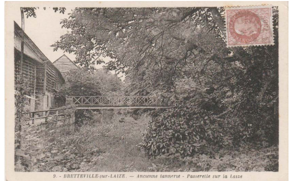
Tannerie et passerelle sur la Laize