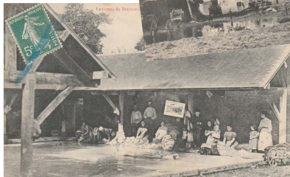
Lavoir aux environs de Bretteville-sur-Laize