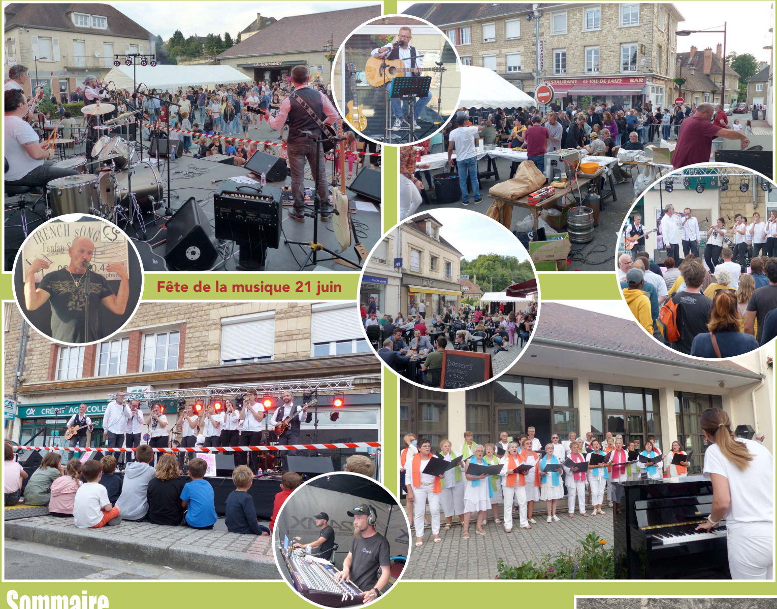
Fête de la musique 21 juin