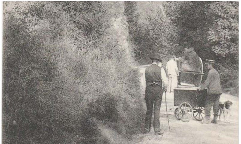
Rémouleur dans la Vallée de la Laize

Les Brettevillais travaillaient sur le territoire de la commune et une part importante de leur activité visait à satisfaire des besoins locaux. Les jardins satisfaisaient en grande partie les besoins alimentaires et le complément se faisait auprès des commerçants du village ou des communes limitrophes. Maréchaux-ferrants, charrons, taillandiers ou encore chaudronniers fabriquaient outils et ustensiles, tandis que tailleurs, couturières, brodeuses ou encore cordonniers façonnaient vêtements ou chaussures.