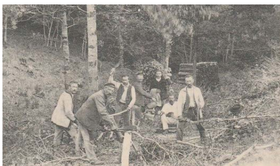
Bûcherons en forêt