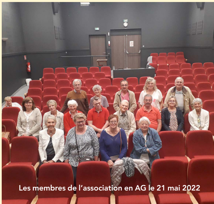
Les membres de l'association en AG le 21 mai 2022

Tarifs ticket : Adultes : 5,40 € / Enfants : 4,40 € Cartes : Adultes 4 places : 17,60 € / Jeunes 3 places : 11,40 €