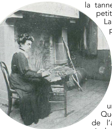
«Dentellières d'hier, d'aujourd'hui et de demain», La Revue illustrée du Calvados, 1910 (AD14, 14T/23/1/2/2)

L'activité la plus précaire était celle des 90 journaliers de la commune. Payés à la journée, ils accomplissaient les tâches ne demandant pas de qualifications particulières. L'activité de dentellière de l'épouse voire des filles devenait alors essentielle dans l'économie familiale.